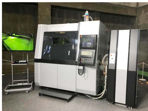
リニアモータ駆動 精密金属3Dプリンタ 「OPM350L」

その他、「Sodick - IoT」「ソディック製セラミックス」「MotionExpert ® - S」などの多数の展示をおこなっております。